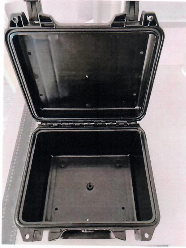
Ürün fotoğrafı 3 / Product photo 3