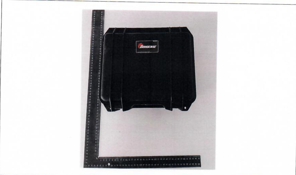
Ürün fotoğrafı 1 / Product photo 1