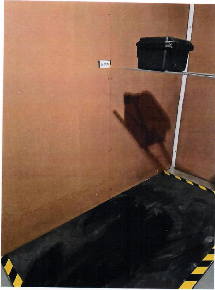
Ürün fotoğrafı 4 / Product photo 4